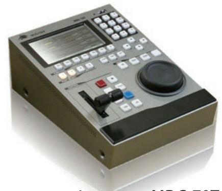
スローコントローラー MDC-70T （オプション）